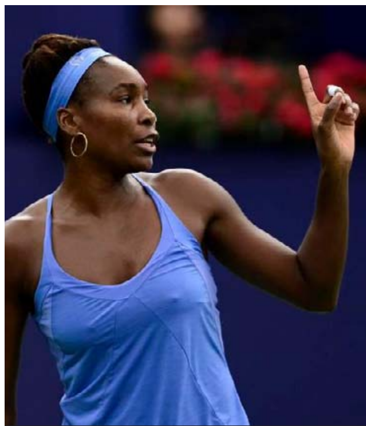
Elle n'a jamais atteint la finale dans le désert californien.