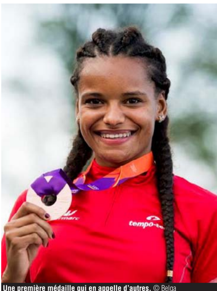
Une première médaille qui en appelle d'autres.

En arrivant en Suède, la médaille n'était pas l'objectif majeur. « Avec le huitième temps des engagées, on pensait surtout à la finale. Mais après ses deux premiers tours, on se disait que tout était possible. Avant sa finale, je lui ai dit de tout donner, de n'avoir au-